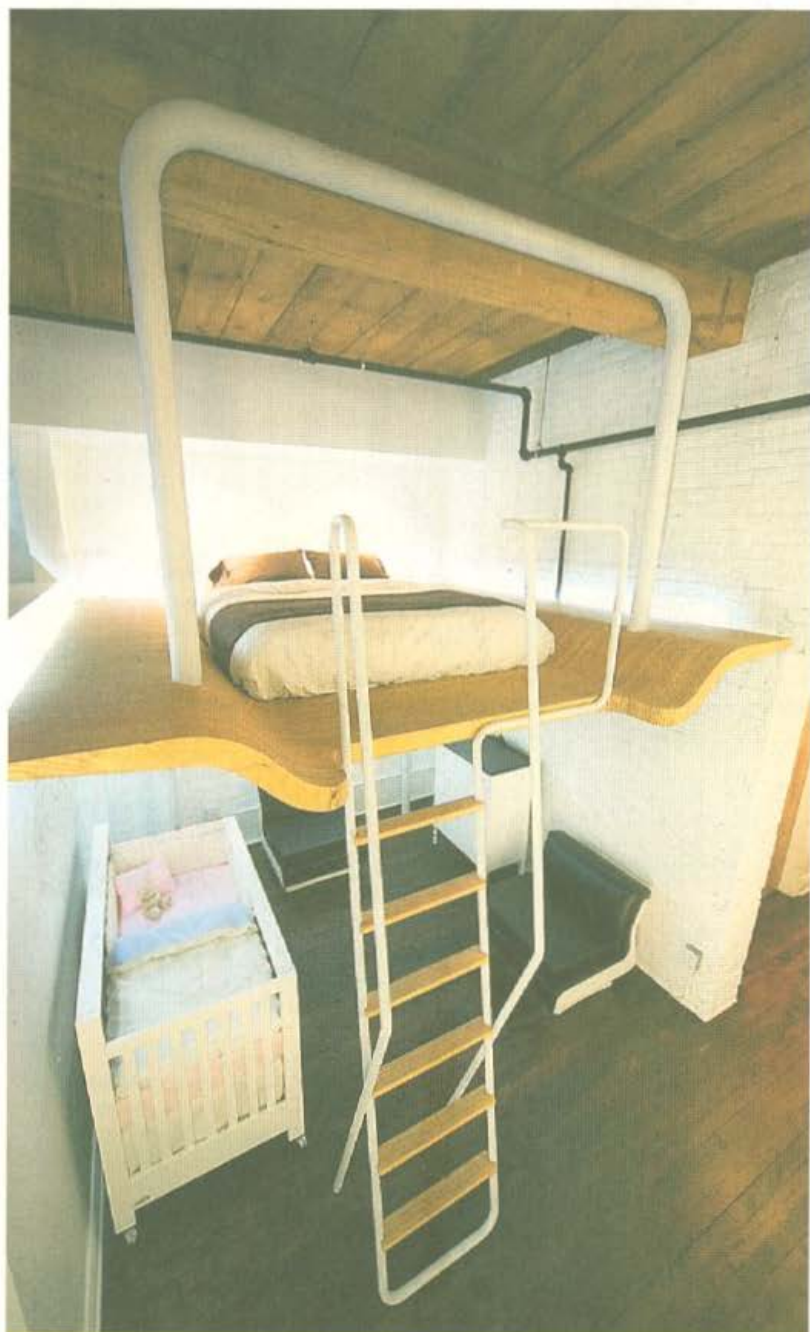
L'aménagement d'une mezzanine dans ce condo de 700 pieds carrés a permis à l'agence Duchesneau & McComber de rafler un Prix d'excellence 2009, de l'Ordre des architectes du Québec.